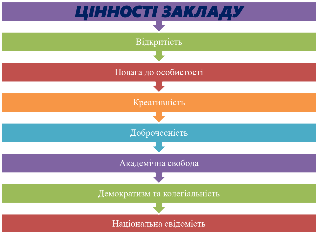
Рисунок 1 Цінності закладу